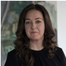
Lone Flohr CEO Combitech / Partner